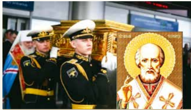
В мае 2017 г. святыню привезли в Россию спецрейсом из итальянского города Бари

Святитель Николай учит нас и царице добродетелей — любви. Он сам стяжал любовь: Господь даровал ему за смирение эту благодать — творить добро людям. У нас часто не получается делать добро, страсти мешают отдавать себя, чем-то жертвовать. Например, страсть наживы — сребролюбие, жадность — мешает делиться с ближними. Чтобы мы могли это делать, нужно учиться у святых, которые стяжали этот дар.