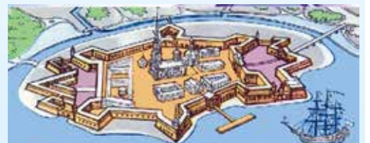
Первые укрепления крепости состояли из земляного вала и шести деревянных бастионов. За 4 летних месяца 1703 года строительство было закончено: устроены земляные валы, зажжён маяк, на валах установлены 150 орудий. Уже через 2 года земляные бастионы стали постепенно заменять 12-метровыми каменными стенами.