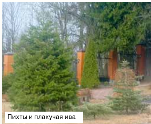
Пихты и плакучая ива

А вот сербская сосна (слева при входе в ворота сада) неподалёку от маньчжурского