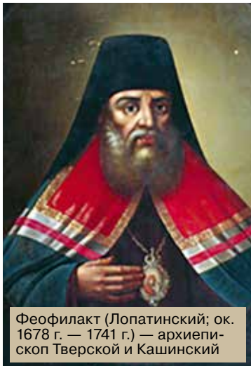
Феофилакт (Лопатинский; ок. 1678 г. — 1741 г.) — архиепископ Тверской и Кашинский

В 1728 г. владыка издаёт запрещённый при Петре I богословский труд митрополита Стефана (Яворского) «Камень веры», яв-