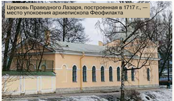
Церковь Праведного Лазаря, построенная в 1717 г., — место упокоения архиепископа Феофилакты

Спустя три года, в декабре 1738 г., Феофилакт был осуждён по старым недоказанным обвинениям: «...подлежит лишить его архиерейства и всего священного и монашеского чина и за надлежащим караулом послать его в Выборг и содержать там в замке, называемом Герман, до смерти его, никуда неисходно, под крепким караулом, не допуская к нему никого, також бумаги и чернил ни для чего ему отнюдь дано бы не было». Потрясённого несправедливым и суровым приговором Феофилакты полуживым привезли в Выборг, где его содержали в башне Святого Олава под караулом до его освобождения в декабре 1740 г.