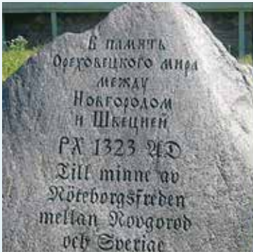
Памятный камень в крепости Орешек

По договору западная часть Карельского перешейка и соседняя с ней область Саволак отошли к Шведскому королевству, восточная часть перешейка с Корелой (сейчас Приозерск) осталась в составе Новгородской земли. Впервые официально была установлена государственная граница, проходившая от Финского залива по