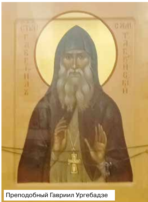
Преподобный Гавриил Ургебадзе