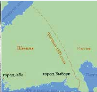
Граница по Ореховскому договору

реке Сестре, на севере до озера Сайма и затем на северо-западе до берега Каяна моря.