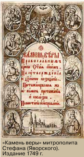
«Камень веры» митрополита Стефана (Яворского). Издание 1749 г.