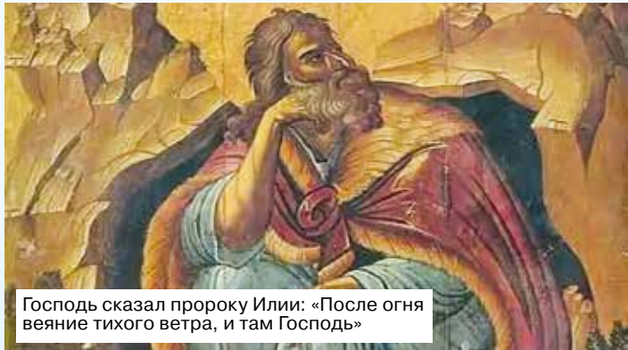
Господь сказал пророку Или: «После огня веяние тихого ветра, и там Господь»

В передаче «Очевидное — невероятное» на тему «Мышление и язык» академик Сергей Капица спросил профессора Татьяну Черниговскую о том, что такое сознание. И получил крайне неожиданный для доктора биологических наук ответ. Лучшим определением сознания, по её мнению, является образ ветра. Потому что сознание, как и ветер, мы можем видеть лишь в его проявлениях.