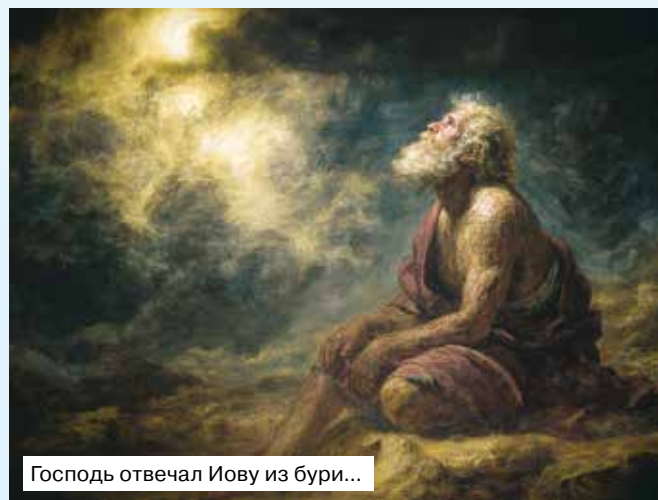
Господь отвечал Иову из бури...

В Новом Завете Дух Святой называется Утешителем: «И Я умолю Отца, и даст вам другого Утешителя, да пребудет с