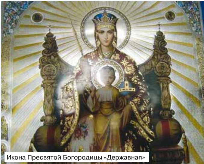
Икона Пресвятой Богородицы «Державная»

А в целом, за исключением ещё некоторых неточностей и формальных недоработок, это могла бы быть хорошая песня. Поэтому мы решили в приходе петь это песнопение Богородице, но только отредактировав текст и переделав неудачные строчки. В исправленном виде первое двустушие