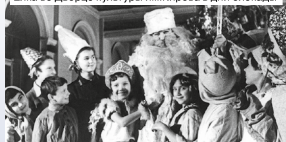
Ёлка во Дворце культуры им. Кирова в дни блокады

Несколько лет назад под Рождество меня пригласили выступить на радио (не православном) в новогодней передаче. Собираясь, я почему-то прихватила с собой последние три номера детской православной газеты «Чадушки». И это оказалось промыслительно. Среди множества вопросов был и такой: «А о чём просят Бога ваши православные дети в канун Нового года? Наверное, как и все дети, – подарков побольше, конфет, походов в театры на праздничные представления?» А как раз в последнем – рождественском - номере «Чадушек» были опубликовали письма детей, которые поделились тем, о чём они просят Бога. Вот эти просьбы: