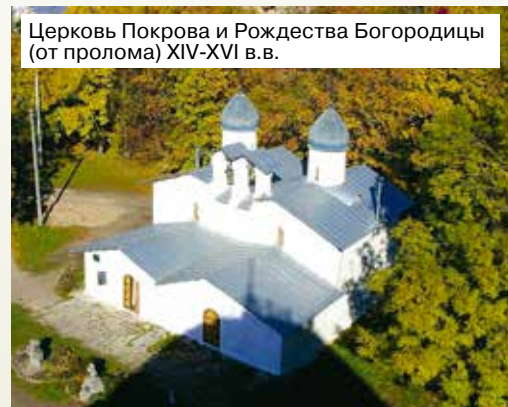
Церковь Покрова и Рождества Богородицы (от пролома) XIV-XVI в.в.

Рядом с Покровской башней находятся церкви Покрова и Рождества Богородицы «от Пролома» XIV века. Это две маленькие церквушки, имеющие общую стену и одинаковую архитектуру. Церковь Покрова была построена в 1399 году, а в 1582 году к ней была пристроена церковь Рождества. Почему же вдруг понадобилось пристраивать ещё одну церковь к уже существующей?