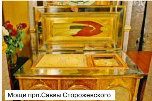
Мощи прп.Саввы Сторожевского

старцем Саввой царя Алексея Михайловича от медведя во время охоты (важно духовное и политическое значение этого события), а второе — явление прп.Саввы пасынку и на-