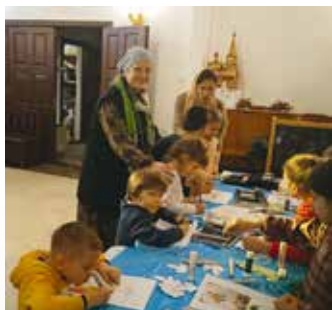
Матушка Елена на занятиях в воскресной школе