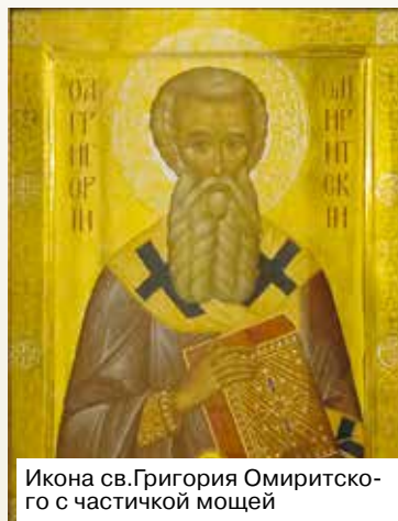
Икона св.Григория Омиритского с частичкой мощей