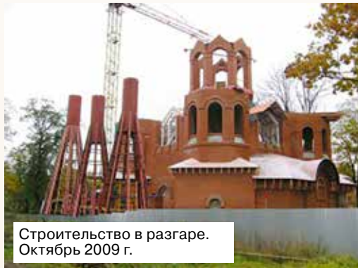
Строительство в разгаре. Октябрь 2009 г.

Прославление Иоанна Крестителя, о котором Сам Господь сказал, что «Из рожденных женами не восставал больший Иоанна Крестителя» (Мф.11.11), — это очень важное свидетельство, к которому христиане всех времён относились и поныне относятся с благоговейным тре-