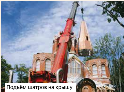
Подъём шатров на крышу

Решение о строительстве храма было принято ещё в 2004 году. При содействии администрации Юкковской волости приходу храма в честь Рождества Иоанна Предтечи был выделен земельный участок для возведения Дома Божиего. В 2005 году на месте строительства был вырыт котлован и поставлен поклонный крест.