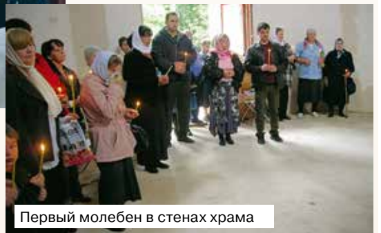
Первый молебен в стенах храма

8 июля 2014 года Преосвященнейшим Игнатием, епископом Выборгским и Приозерским, был освящён нижний храм в честь священномученика Киприана и мученицы Иустины, выполненный в стиле греческих