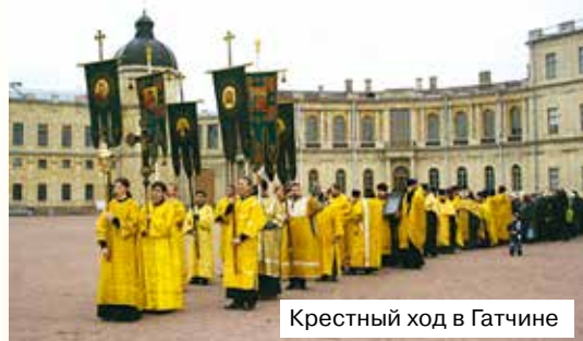
Крестный ход в Гатчине

турками в 1453 году святыня досталась турецкому султану, а в 1481 году была им подарена главе рыцарского ордена госпитальеров. В XVI веке рыцари обосновались на острове Мальта, после чего их орден получил название Мальтийского. В 1798 году Мальта была взята войсками Наполеона, и русский император Павел I дал мальтийским рыцарям убежище в России. В 1799 году святыни ордена — правая рука Иоанна Предтечи, часть древа Животворящего Креста Господня, Филермская икона Божией Матери — были доставлены в Гатчину. В честь этого события и был