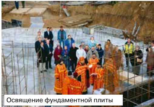
Освящение фундаментной плиты

«Каждый святой храм — это частица Неба на земле. И когда ты в храме, то, смотри, ты уже на Небе. Когда земля измучит тебя своим адом, ты поспеши в храм, войди в него, и вот — вошёл ты в рай. И если случится, что на тебя нападут целые легионы демонов, ты беги в храм — стань среди святых Ангелов, ибо храм всегда полон