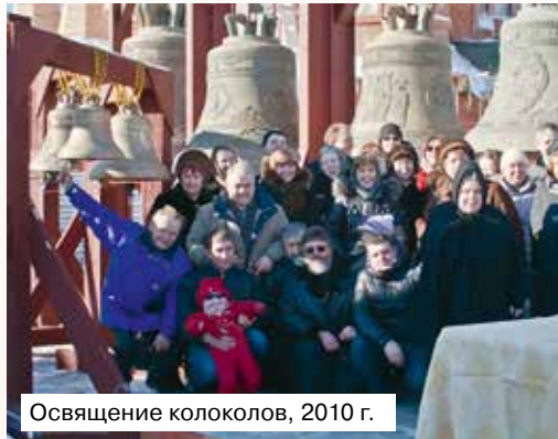
Освящение колоколов, 2010 г.

С 2004 года сменилось 8 настоятелей, но непосредственно храм начал строиться в 2009 году, когда обязанности председателя Приходского Совета принял заслу-