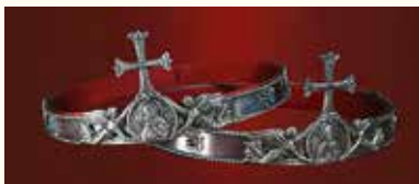
Венчальные обручи (по образцу византийских)

О брачных венцах часто упоминается в Священном Писании. В древние времена венцы делались из живых цветов, миртовых или виноградных ветвей или представляли собой особые головные повязки жениха и невесты. Венцы эти всегда понимались как знамения победы над плотскими соблазнами жениха и невесты и непорочности их отношений до брака. В христианстве венцы возымели ещё более глубокий духовный смысл. Сам Спаситель указал на человеческий брак как на прообраз духовного союза Христа с Церковью (Мф.9.15). Эта же мысль содержится и в Песни песней, пророчески изображающей