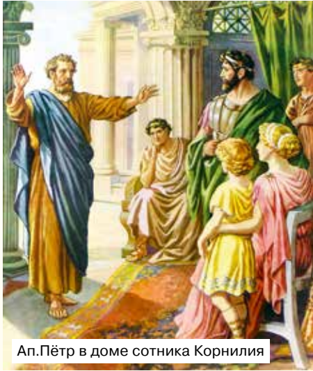
Ап.Пётр в доме сотника Корнилия

Если этого не происходит, то любовь постепенно уходит, и человек начинает искать больше земной славы, богатства, земной власти, как в сказке о золотой рыбки та старуха, которая захотела стать владычицей морской. То есть, по сути дела, это то духовное состояние, когда