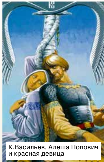
К.Васильев, Алёша Попович и красная девица