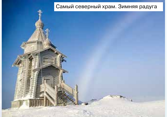
Самый северный храм. Зимняя радуга

Литургию в воскресенье собирается человек 5-6, даже чилийцы приходят. У них есть свой небольшой костёл, но священников нет, вот и приходят некоторые к нам — постоять, помолиться. Поэтому мы всегда читаем Евангелие на двух языках, дублируем на испанском некоторые ектении, Символ Веры, Отче наш, готовим для них проповеди. Так что в этом смысле наш храм — вполне миссионерский.