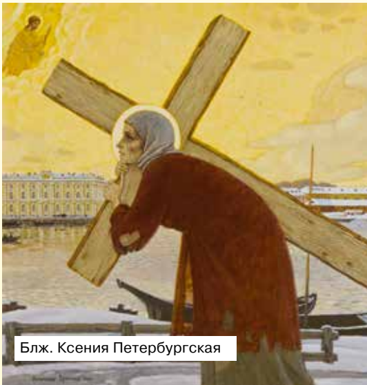
Блж. Ксения Петербургская