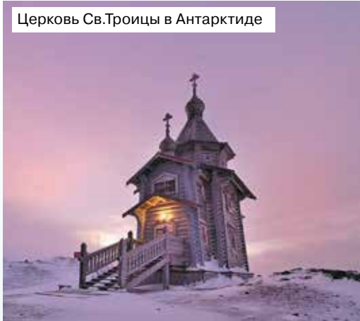
Церковь Св.Троицы в Антарктиде

Как ни странно, Антарктида была открыта по историческим меркам совсем недавно, меньше чем двести лет назад, в январе 1820 года. До этого времени огромный участок суши, целый континент, пусть и покрытый ледовым панцирем, оставался неведомым вполне просвещенному на тот момент человечеству. И это, может быть, самое грандиозное из последних географических открытий, принадлежит русским мореплавателям — Ф.Ф.Беллинсгаузену и М.П.Лазареву, которые на шлюпах «Восток» и «Мирный» первыми достигли берегов шестого континента.