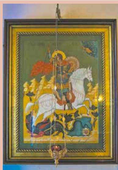
ИКОНЕ ГЕОРГИЯ ПОБЕДОНОСЦА В ХРАМЕ РОЖДЕСТВА ИОАННА ПРЕДТЕЧИ В ЮККАХ

Стою пред иконою светлой, Где воин в плаще и с копьём, Незримо славой одетый В бессмертном стоянье своём, Ведёт вековечную битву В сражении света со злом. И образом этим с молитвой Укрыта страна как щитом. Он к нам из небесного края Пришёл в нашу русскую боль, Сражаясь, храня, помогая, Столь русский для русского, столь Всей жизнью святою понятный И близкий душе и уму, Что воин в нём видит собрата, А матушка — стража в дому. Покрыта хоругвями слава История в нашей стране, Где воин великой державы, Хранитель на белом коне.