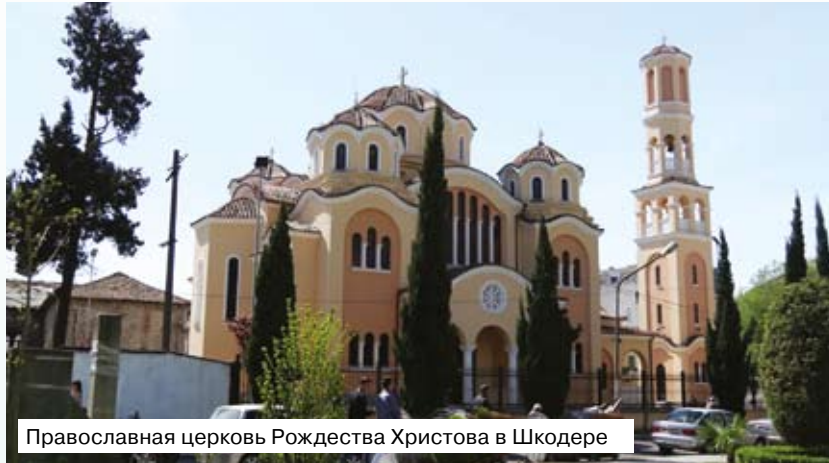
Православная церковь Рождества Христова в Шкодере