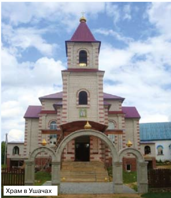
Храм в Ушачах

День поминовения иконы — Праздник Святой Троицы и Святого Духа (день обретения иконы) и 23 (10 ст.ст.) сентября.