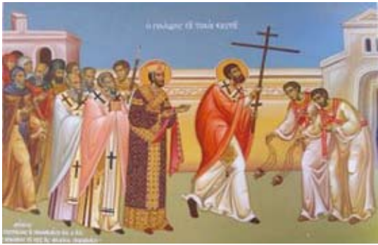
14 августа — Происхождение (изнесение) Честных Древ Животворящего Креста Господня