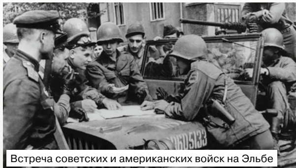
Встреча советских и американских войск на Эльбе

Потом меня отправили в ФЗО, поселили в общежитии на набережной недалеко от Дворцовой площади. И снова судьба пощадила меня. Мы — два десятка человек — собрались в баню. И в этот момент снаряд попал в подъезд, где все собрались. Многих убило, других тяжело ранило. А мне только ногу задело осколком.