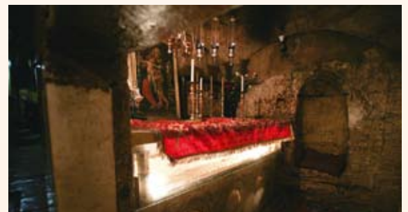
Гробница Пресвятой Богородицы

событиях Успения и погребения Богородицы нам известно из нескольких апокрифов, являющимися достаточно поздними - V—VI века. Но согласно преданию, мы знаем, что Мать Божия после Своего Успения была погребена в семейной усыпальнице у подножия западного склона Елеонской горы, в долине Кедрон, в месте, называемом Гетсиманией. Над гробницей и была построена пещерная церковь Успения Богородицы в конце IV века, а в середине V-го перестроена патриархом Ювеналием: вокруг погребальной пещеры был вырублен широкий проход и образован подземный храм крестообразной формы, а верхний храм расширен