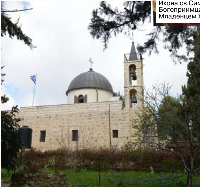
Катамон, Иерусалим. Храм прав. Симеона Богоприимца

был на нем» (Лк. 2.25). Но когда прав. Симеон углубился в изучение книги пророка Исайи, он прочитал слова, которые несказанно поразили и смутили его - «Се Дева во чреве приимет и родит Сына» (Ис. 7.14). Праведный Симеон подумал, что это явная описка и вместо «Дева» должно стоять «Жена», и вознамерился исправить текст. Однако Ангел Го-