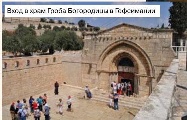
Вход в храм Гроба Богородицы в Гетсимани