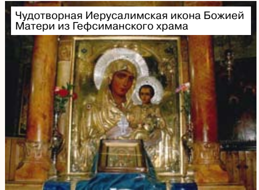
Чудотворная Иерусалимская икона Божией Матери из Гетсиманского храма

Сама пещера, где находится трёхдневный гроб Пречистой, вся увешана горящими лампадами. Кстати, канонические тексты не сообщают о времени и обстоятельствах кончины и погребения Богородицы. До V века отцы Церкви не упоминают об Успении Богородицы, и до VI века Успение не праздновалось среди христиан как церковный праздник. О