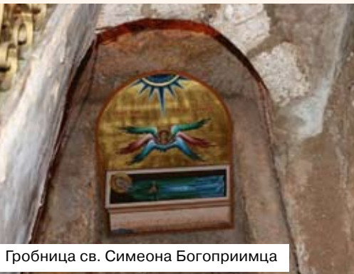
Гробница св. Симеона Богоприимца

сподень остановил руку св. Симеона и уверил его, что ошибки нет, а сам он не умрёт, пока не убедится в истинности данного пророчества, т.е. пока не узрит живого Спасителя. Что и произошло, как мы знаем из Евангелия. По преданию, Симеон скончался сразу после Сретения (встречи) с Господом, в возрасте 360 лет (согласно житию Симеона, составленного свт. Димитрием Ростовским).