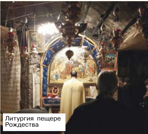
Литургия пещере Рождества

Удивительная история обнаружения пещеры, в которой появился на свет Богомладенец. После иудейских восстаний в I-II веках римляне, не особо отличавшие христиан от иудеев, стали усиленно насаждать здесь язычество. И как раз над пещерой, которую особо почитали христиане Вифлеема (здесь родился Христос) было возведено капище Таммуха — финикийского божества и насажена «священная роща». Но именно это помогло св.царице Елене точно и достоверно определить место, где находился св.Вертеп. Как мы знаем из церковной истории, святая царица в 325 году впервые пришла на Святую Землю и стала обозначать места, где проповедовал Спаситель, где протекала земная жизнь Сына Божиего Иисуса Христа. И 31 мая 339 года здесь была освящена обширная церковь. К сожалению, та первая церковь