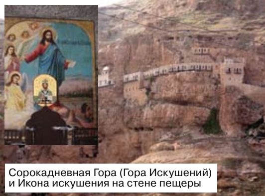
Сорокадневная Гора (Гора Испытаний) и Икона искушения на стене пещеры

Здесь привёл библейский пророк Моисей еврейский народ, который до того в течение 40 лет водил по пустыне. Зачем так долго? Это видно из поведения людей — они постоянно роптали: то им еды мало было, то воды, то золотого тельца себе сделали вместо Бога. То есть, народ Израиля вышел из рабства Египетского, да только рабство не вышло из людских сердец. А с подобными «воинами» завоевание земли, которую Бог обещал ещё Аврааму, было невозможно. Со временем люди,