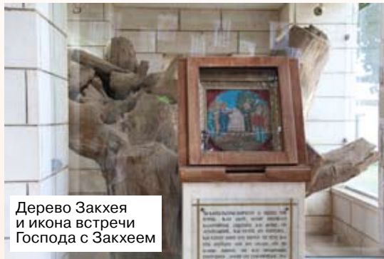
Дерево Закхея и икона встречи Господа с Закхеем

Легендарные иерихонские трубы — именно здесь были использованы, когда евреи обходили стены города для того, чтобы те пали от звуков труб. И глас Господень через их трубы был настолько силен, что стены рухнули.