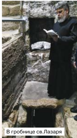
В гробнице св.Лазаря

Вифании был одним из наиболее преданных учеников Христа, который с первой встречи с Иисусом глубоко поверил в Него. И воскрешение Лазаря Спасителем является прообразом будущего воскресения мертвых, ибо у Бога мертвых нет, у Бога все живы.