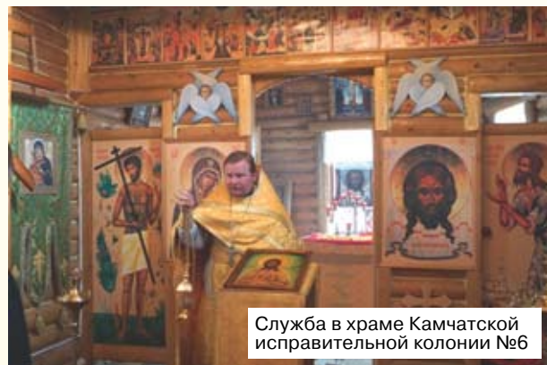
Служба в храме Камчатской исправительной колонии №6

Закончив 11 классов, я ушёл служить в армию. Помню, когда приехал на призывной пункт, увидел человека в морской форме. Это был капитан III ранга, который набирал призывников, годных к морской службе. Мне так захотелось попасть на корабль, ведь мой дед был моряком. Заполняя анкету, в которой было около 300 вопросов, я увидел такой: «Верите ли в Бога?» и написал «Да». У меня не было других вариантов ответа, потому что я — русский, а значит — православный, хотя на деле мало что знал о вере. Конечно, если бы к тому време-