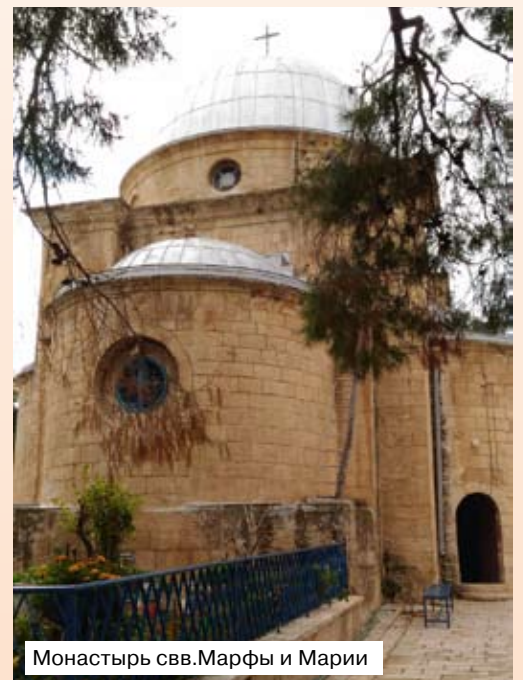
Монастырь св.Марфы и Марии

На следующий день из-за беспорядков в Палестине, нам отказали в службе у колодца Иакова близ г.Шхем (Наблус, древний город в Палестине, основанный около 880 г. до Р.Х.). Вспомним события, связанные с этим колодцем. Иаков, возвращаясь из Месопотамии, где он прослужил два раза по семи лет у дяди своего Лавана, благополучно пришёл в г.Сихем, раскинул здесь свои шатры и воздвигнул жертвенник Всемогущему Богу Израиля. Он выкупил эту часть поля и вырыл там глубокий коло-